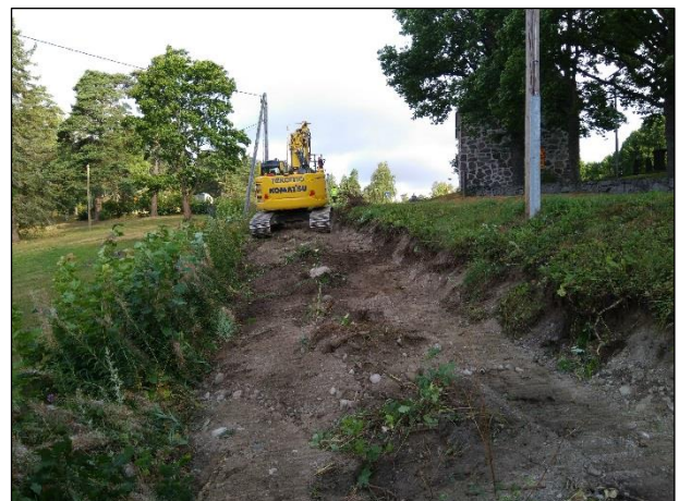
Maakaapelilinjaa reitti Pyhän Laurin kirkon lounaispuolella, vasemmalla ennen kaivua ja oikealla tasoitettua maata ennen ojan kaivamista.