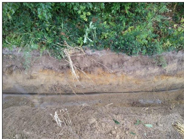
Vasemmalla maakaapelilinjaa pellon ja tien välissä ennen kaivua. Oikealla kaivetun ojan leikkaus.