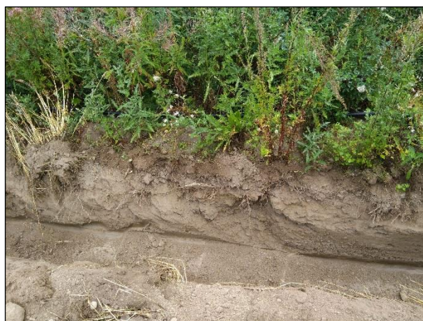
Vasemmalla maakaapelilinjan eteläpäätä pellon laidassa. Oikealla kaivetun ojan seinämä.