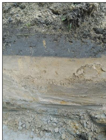
Vasemmalla pellon laitaan kaivettu kaapelioja. Oikealla kaivetun ojan seinämä, jossa maa oli pinnassa kyntökerroksen osalta savea ja syvemmällä keltaista hiekkaa.